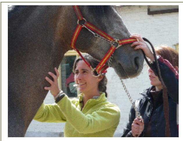
Het nemen van bloed voor DNA registratie

Voor wat betreft West Nile Virus (WNV) adviseert de Groep Geneeskunde Paard (GGP) dat vaccinatie wordt aanbevolen voor paarden die internationaal reizen (vooral naar WNV risico gebieden) en paarden binnen Nederland waarvoor de eigenaar