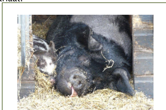
Zelfs hij was er moe van...

Voor meer informatie over de papieren kunt u altijd bellen of mailen naar de penningmeester of het secretariaat.